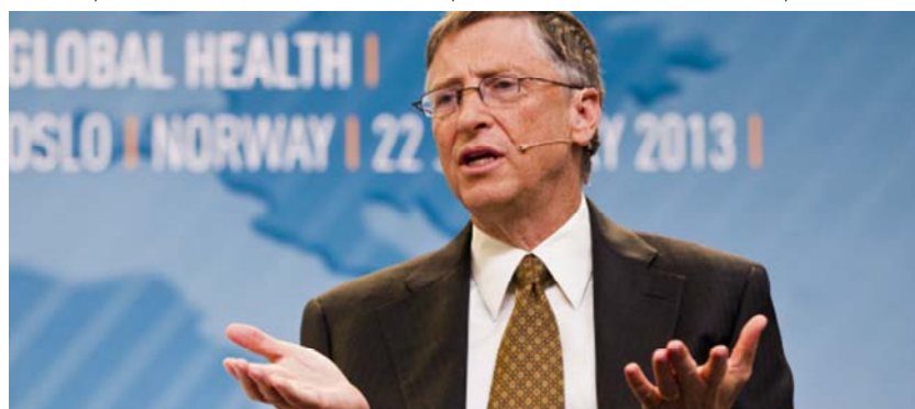
بیل گیتس علاوه بر پولدارترین یکی از بزرگترین خیرین دنیاست