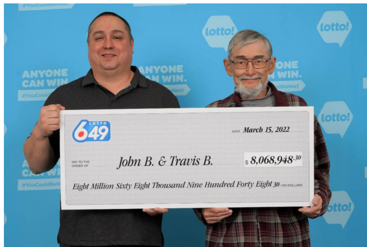
تصویر غم‌انگیز یکی از صدها هزار برندگان لاتاری

سرمایه‌گذاران سطح یک «برندگان قرعه‌کشی» هستند. آنها اطلاعات کمی در مورد سرمایه‌گذاری دارند. این سطح از سرمایه‌گذار زمان بسیار کمی را صرف درک پول و سرمایه‌گذاری واقعی کرده‌اند. آنها همیشه به توصیه‌های دیگران - اغلب توصیه‌های بد - تکیه می‌کنند.